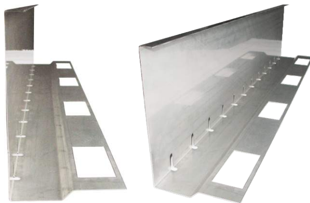
Sonderanfertigung Kiesfangleiste mit Absatz 110 / 170 mm

Sonderanfertigungen nach Ihren Vorgaben sind kein Problem.